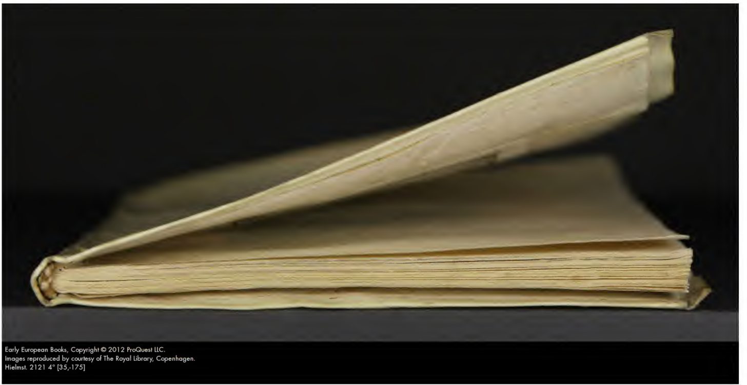
Hielmst. 2121.4° [35.-175]